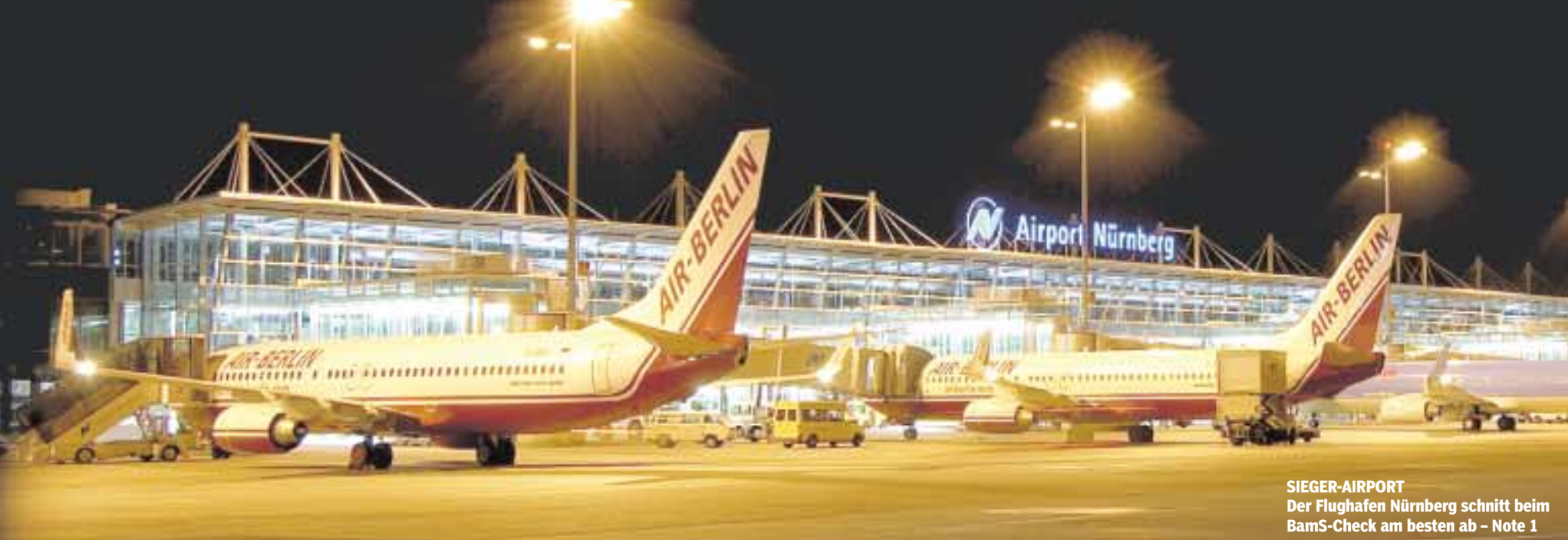
SIEGER-AIRPORT Der Flughafen Nürnberg schneit beim BamS-Check am besten ab – Note 1