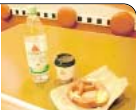
SPAR-MENÜ Wasser 1,75 Euro, Kaffee 1,50 Euro und Brezel für 0,95 Euro

Ankunft & Gepäck Nur 65 Schritte vom Flieger bis zum Kofferband, nach 4:20 Minuten hatte der Tester sein Gepäck – super! Note: 1 Essen & Trinken Großes Angebot: Edles von Leysieffer (Ciabatta 4,50 Euro), Fast-food bei Burger King (Cola 1,25 Euro, Menüs etwa 5 Euro). Supermarkt mit Bäckerei (z. B. Brezel für 0,95 Euro, Wasser (1 l) 1,75 Euro). Vor dem Terminal gibt es den „Ess-Bahn“-Imbiß: Currywurst mit Bier (0,3 l) für 5 Euro! Note: 1