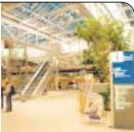
GRÜNE OASE Der Sieger-Flughafen ist hell, sauber, übersichtlich, begrünt

später kamen die ersten Koffer – super! Note 1 Essen & Trinken Alle Restaurants in der Hand von Mövenpick. Zum Beispiel Frühstücksbrunch ab 7,30 Uhr im Marché (8,50 Euro/sonntags 11,50 Euro) inklusive aller heißen Getränke. Zusätzlich diverse Bars am Gate (Kaffee 2,30 Euro, Cola 2,60 Euro). Note 1 Service & Einkaufen Pfirsichduft auf den WCs – da läßt man sich gern nieder! Sogar nachts Kontrollen (3.20