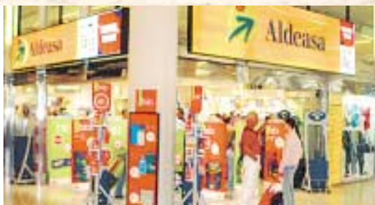
DUTY FREE Im Flughafen gibt es günstig Zigaretten, Spirituosen und Parfüm

Flughafen & Parken Die 10minütige Taxifahrt vom Strand in El Arenal zum Flughafen kostet rund 8 Euro. Hinzu kommen Zuschläge von bis zu 4,50 Euro. Wofür? Kann kein Fahrer erklären. Die Beton-Abflughalle gewinnt zwar keinen Schönheitspreis, ist aber geräumig und bietet viele Sitzplätze. Note: 2 Abflug & Abfertigung Vor jedem Eingang weisen Monitore den Weg zum richtigen Check-in-Schalter. Das Personal ist freundlich und spricht meist gut deutsch. Trotzdem kann der Check-in lange dauern: 20 Minuten sind normal. Dazu kommen bis zu 15 Minuten Wartezeit an der Sicherheitskontrolle. Für den Weg zum Abflugtor muß man weitere 10 Minuten einkalkulieren. Macht zusammen im ungünstigsten Fall 45 Minuten bis zum Flieger! Note: 4 Ankunft & Gepäck Zwischen Flieger und Gepäckbändern liegt meist ein Fußweg von bis zu acht Minuten. Das ist nicht weiter schlimm, denn das Gepäck braucht oft noch länger zum Gepäckband als die Passagiere. Wer Pech hat, wartet locker 25 Minuten auf seine Koffer. Note: 5 Essen & Trinken Essen sollte man besser vor der Fahrt zum Flughafen, denn die Preise sind so gepfeffert wie an deutschen Airports: Schinken-Sandwich ab 3,55 Euro, Tortilla 4,45 Euro, Frankfurter 3,80 Euro, Bulette 4,55 Euro. Kleiner Trost: Milchkaffee ist schon ab 1,20 Euro zu haben (Laden Frutos y Frutas).