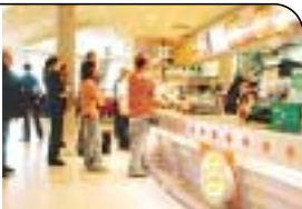
FAST FOOD Wer schnell und billig essen will, kann zu Burger King gehen

Ankunft & Gepäck In 7:20 Minuten vom Flieger zum Kofferband – kurze Wege und ausreichend Gepäckkulis. Note: 2 Essen & Trinken Glas Wasser (0,25 l) für 3,50 Euro – ja spinnen die Schwaben? Aber zum Glück gibt es reichlich Alternativen: Im Untergeschoß gibt's einen Bäcker mit Supermarkt (Kaffee für 1,55 Euro, belegtes Brötchen ab 1,90 Euro). Außerdem ein Burger King. Note: 2 Service & Einkaufen Zum Teil ausgefallene