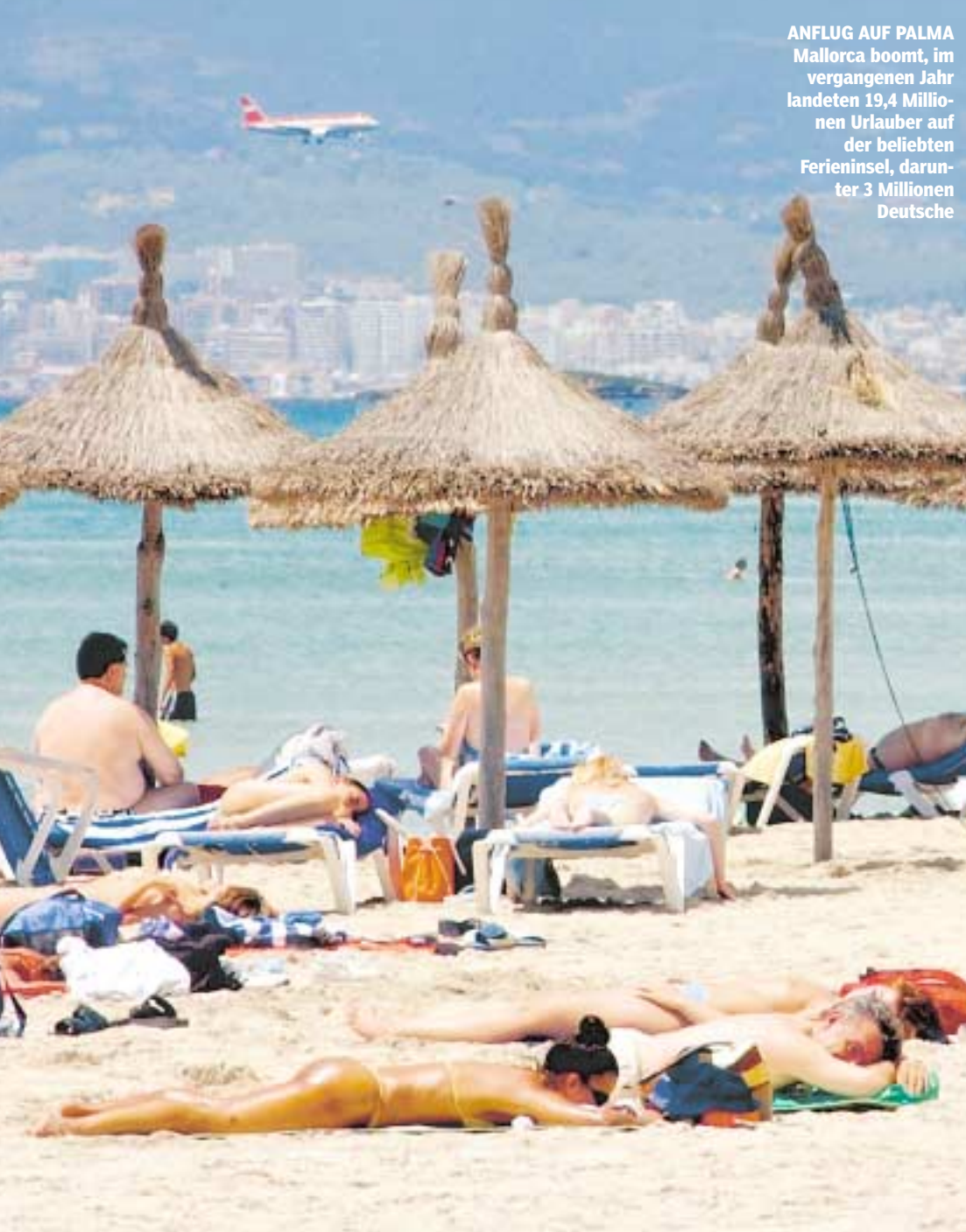
ANFLUG AUF PALMA Mallorca boomt, im vergangenen Jahr landeten 19,4 Millionen Urlauber auf der beliebtesten Ferieninsel, darunter 3 Millionen Deutsche

Flughafen & Parken Die 10minütige Taxifahrt vom Strand in El Arenal zum Flughafen kostet rund 8 Euro. Hinzu kommen Zuschläge von bis zu 4,50 Euro. Wofür? Kann kein Fahrer erklären. Die Beton-Abflughalle gewinnt zwar keinen Schönheitspreis, ist aber geräumig und bietet viele Sitzplätze. Note: 2 Abflug & Abfertigung Vor jedem Eingang weisen Monitore den Weg zum richtigen Check-in-Schalter. Das Personal ist freundlich und spricht meist gut deutsch. Trotzdem kann der Check-in lange dauern: 20 Minuten sind normal. Dazu kommen bis zu 15 Minuten Wartezeit an der Sicherheitskontrolle. Für den Weg zum Abflugtor muß man weitere 10 Minuten einkalkulieren. Macht zusammen im ungünstigsten Fall 45 Minuten bis zum Flieger! Note: 4 Ankunft & Gepäck Zwischen Flieger und Gepäckbändern liegt meist ein Fußweg von bis zu acht Minuten. Das ist nicht weiter schlimm, denn das Gepäck braucht oft noch länger zum Gepäckband als die Passagiere. Wer Pech hat, wartet locker 25 Minuten auf seine Koffer. Note: 5 Essen & Trinken Essen sollte man besser vor der Fahrt zum Flughafen, denn die Preise sind so gepfeffert wie an deutschen Airports: Schinken-Sandwich ab 3,55 Euro, Tortilla 4,45 Euro, Frankfurter 3,80 Euro, Bulette 4,55 Euro. Kleiner Trost: Milchkaffee ist schon ab 1,20 Euro zu haben (Laden Frutos y Frutas).