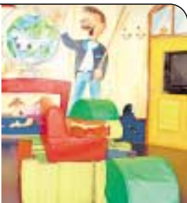
MÜLLHALDE Die ranzige Kinderspielecke vor Abflugtor 14 (Terminal C)

erste Koffer liegt 11 Minuten nach der Landung auf dem Band. Note: 1 Essen & Trinken Schwarzer Tee kostet in Terminal C 2,40 Euro. Tip: Bäcker Bosselmann in Terminal B bietet faire Preise. Belegte Brötchen gibt's ab 1,99 Euro. Note: 3 Service & Einkaufen Stoffelige Verkäufer und dünnes Angebot: Parfüm, Sonnenbrillen, Kravatten und aufblasbare Nackenkissen für die Reise. Das Kinderparadies in Terminal C ist die Hölle: Hier liegen völlig verdreckte und